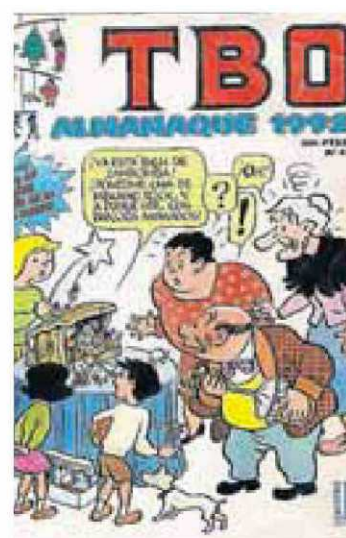
Algunas de las portadas del TBO, que se empeñó en hacer honor a su máxima de que 'La alegría es la riqueza de los pobres'.