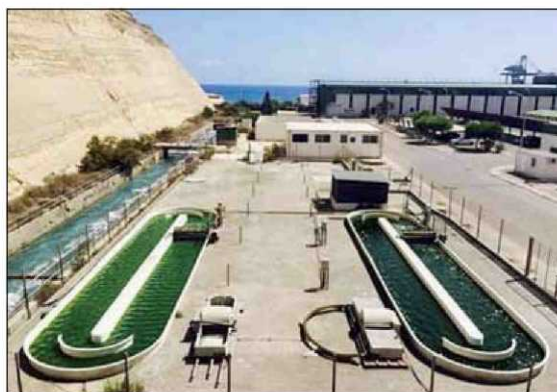
Carboneras tiene una planta piloto de microalgas. DL

btener superalimentos de microalgas, y validar los resultados en la central térmica que la eléctrica Endesa tiene en Carboneras, es el objetivo de un proyecto financiado con fondos Feder que pretende convertir a España en líder de la biotecnología para rentabilizar el cultivo de las microalgas