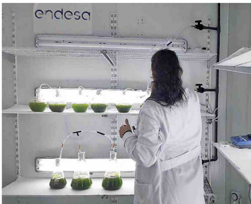
El proyecto estudia biocompuestos de microalgas con aplicaciones alimentarias. DL

Los desarrollos se centrarán en diferentes cepas de spirulina, nannochloropsis gaditana y pyrocistis. Y los resultados del proyecto se validarán en la planta piloto de microalgas que Endesa tiene desde 2006 en Carboneras, con el objetivo de demostrar los usos de las microalgas y sus extractos de in-