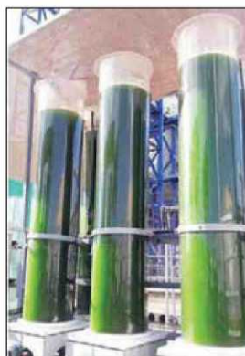
El estudio de la bioluminiscencia es uno de los que se desarrollan. DL