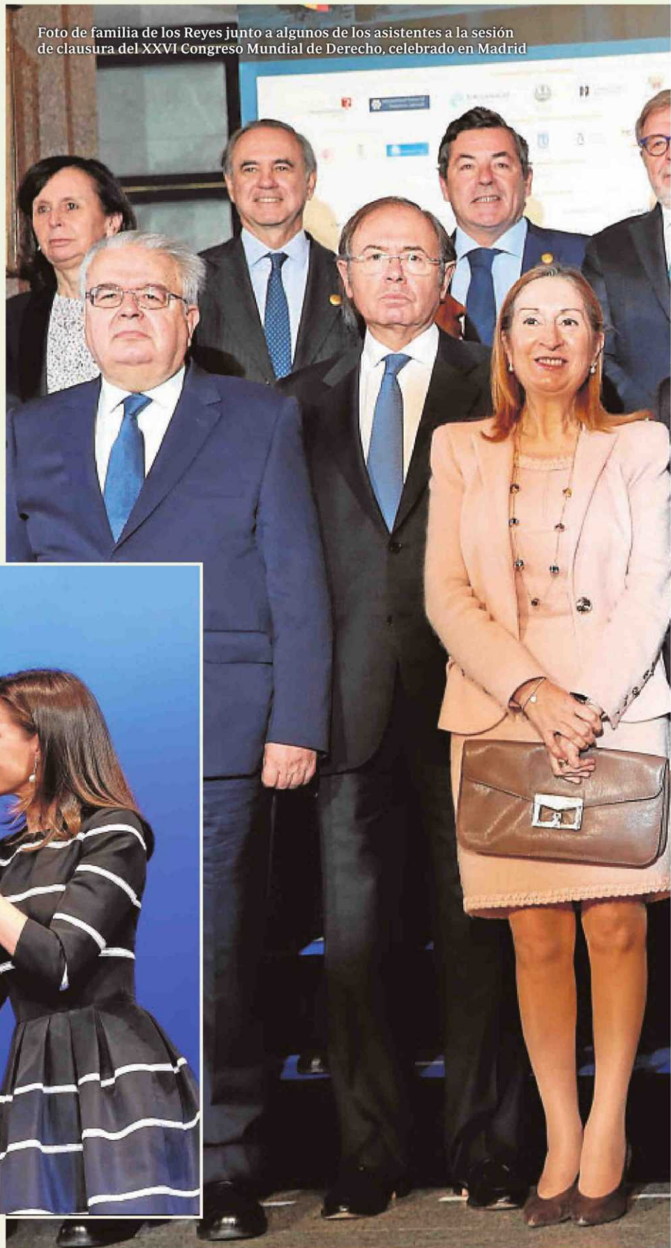
Foto de familia de los Reyes junto a algunos de los asistentes a la sesión de clausura del XXVI Congreso Mundial de Derecho, celebrado en Madrid

Como en aquel memorable discurso del 3 de octubre, el Rey, de nuevo ejemplar, volvió a salir ayer en defensa de la democracia y de la ley y vino a desmontar, sin citarles, los argumentos esgrimidos por los independentistas catalanes en el juicio del «procés». Porque como dijo Don Felipe, «sin democracia, el Derecho no sería legítimo; pero sin Derecho, la democracia no sería ni real ni efectiva». Por eso, «no tiene sentido, no es admisible, apelar a una supuesta democracia por encima del Derecho», añadió el Rey, que volvió a llamar al respeto a las leyes, sin el que no existe «ni convivencia ni democracia, sino inseguridad, arbitrariedad y, en definitiva, quiebra de los principios morales y cívicos de la sociedad». Dos minutos de cerrado aplauso cosechó el Rey en su discurso de agradecimiento tras recibir el Premio Mundial de la Paz y la Libertad, que concede la Asociación Mundial de Juristas. Un galardón tan excepcional que, en sus 55 años de historia, solo lo han recibido Winston Churchill, René Cassin, Nelson Mandela y ahora Don Felipe. [ESPAÑA]