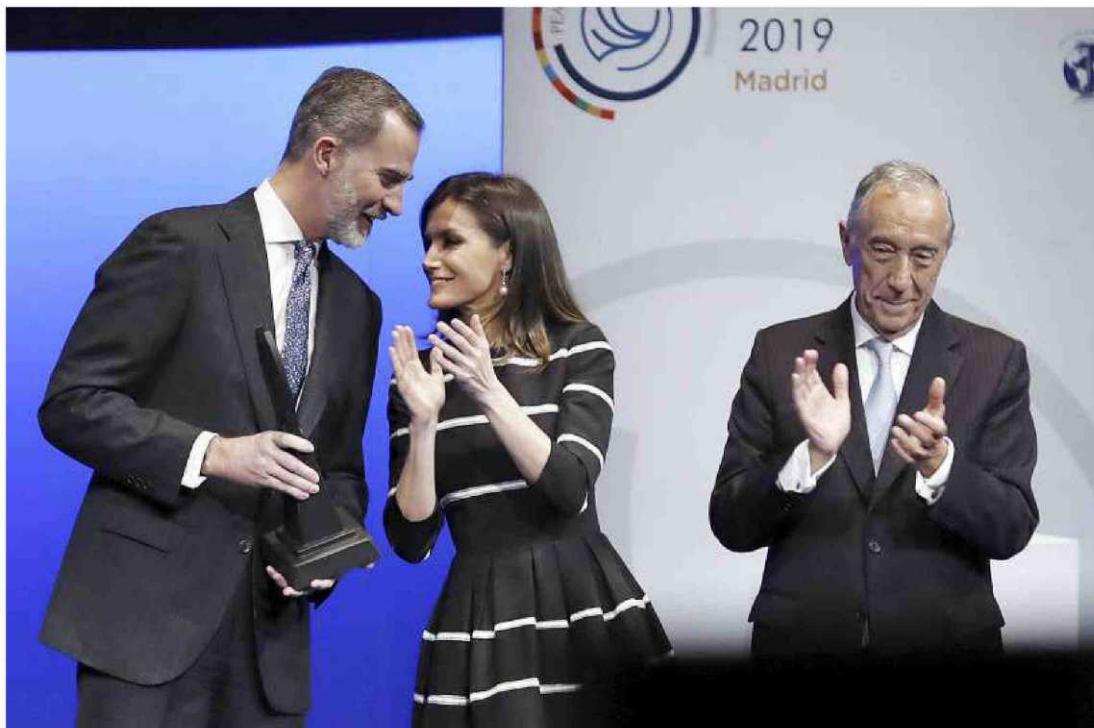
El Monarca fue premiado ayer por la Asociación Mundial de Juristas en un acto al que acudió con Doña Letizia y en el que estuvo presente el presidente de Portugal (d).