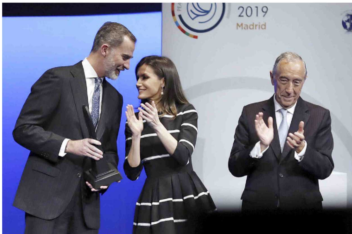
El Monarca fue premiado ayer por la Asociación Mundial de Juristas en un acto al que acudió con Doña Letizia y en el que estuvo presente el presidente de Portugal (d).