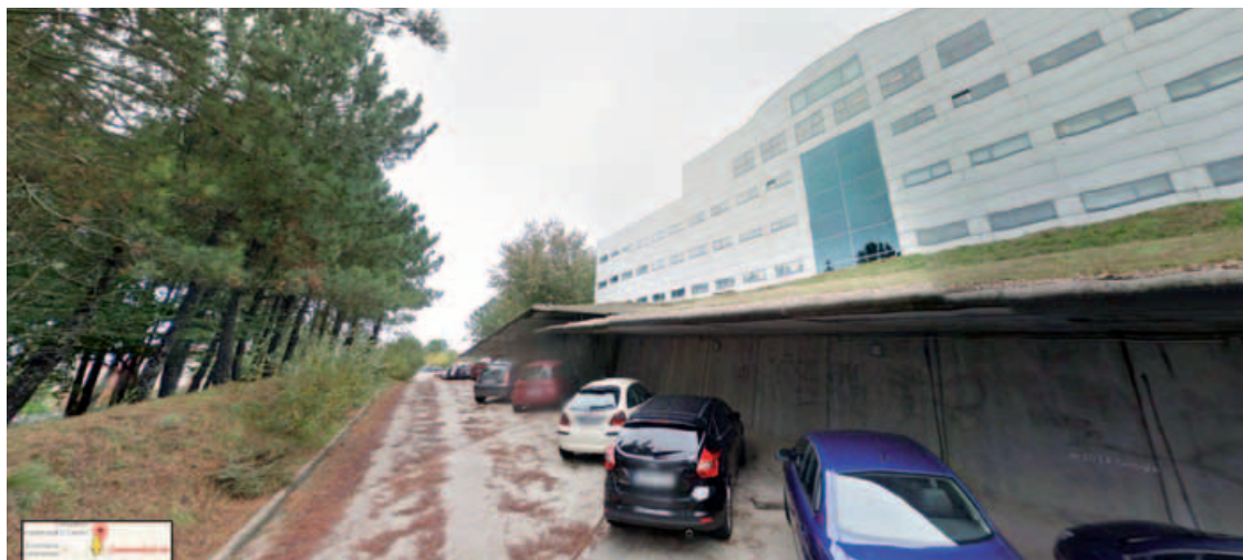
Un lateral de la Universidad de Vigo, a través de la herramienta de Google.

Google Street View permite ver en 360° la Universidad de Vigo, el estadio de Balaídos, la Torre de Hércules y la muralla de Lugo