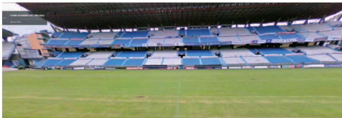
Vista del estadio de Balaídos.

equipada con un sistema de cámaras en la parte superior, ha permitido el desplazamiento por sitios angos-