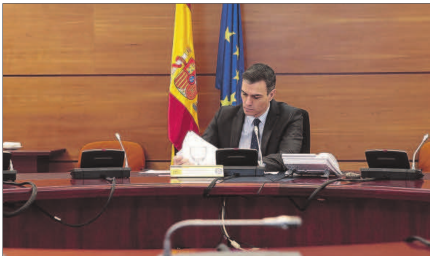
El presidente del Gobierno, Pedro Sánchez.

El montante español es muy inferior al de otros planes de garantías europeos. Así, por ejemplo, en Italia (país más dañado por la pandemia) el programa de avales del Estado asciende a 350.000 millones, lo que representa cerca de un 20% del PIB, mientras que en Alemania, la cuantía se sitúa en 550.000 millo-