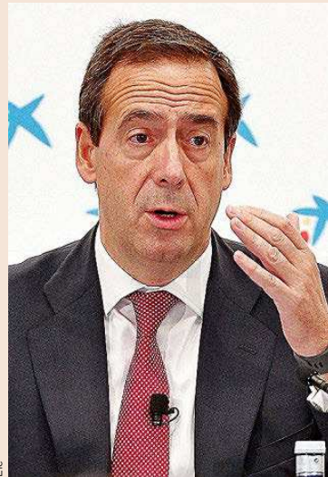
Gonzalo Gortázar, consejero delegado de CaixaBank.

Estas ayudas fiscales, equivalentes al 5% del tamaño de la economía, contrastan, según la banca, con el 2,8% de España.