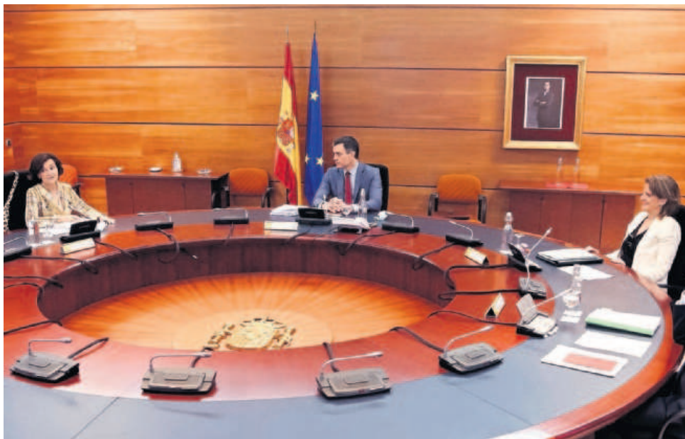
El presidente del Gobierno, Pedro Sánchez, presidiendo la reunión del Consejo de Ministros de este martes.

Asimismo, Sánchez acordó agilizar el pago de las prestaciones de ERTE o desempleo a aquellos que aún no las hayan cobrado, de forma que sean abonadas en el mismo mes de mayo o durante junio, como tarde. Por otra parte, el Ejecutivo aceptó estudiar la ampliación más allá del estado de alarma de la prestación extraordinaria por cese de actividad de los trabajadores autónomos, así como las exenciones de sus cuotas a la Seguridad Social.