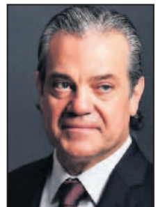
Marcos de Quinto.

► Desacuerdo. El diputado de Ciudadanos y portavoz económico, Marcos de Quinto, decidió ayer abandonar el partido que lidera Inés Arrimadas por estar en desacuerdo con la dirección de Cs, minutos después de que esta optara por apoyar de nuevo al Gobierno en la prórroga del estado de alarma que se vota hoy en el Congreso. En la última ampliación, el diputado