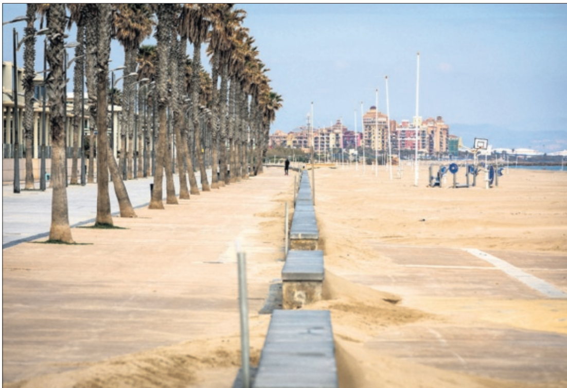
Paseo de la playa de la Patacona, en Valencia, vacía el jueves durante la Semana Santa.

R. Si puedo disfrutar de unos días, optaré por el campo, el turismo de naturaleza. Pero que el conjunto de la oferta española se recupere a la misma velocidad.