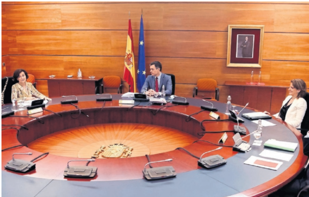
El presidente del Gobierno, Pedro Sánchez, presidiendo la reunión del Consejo de Ministros de este martes.

Asimismo, Sánchez acordó agilizar el pago de las prestaciones de ERTE o desempleo a aquellos que aún no las hayan cobrado, de forma que sean abonadas en el mismo mes de mayo o durante junio, como tarde. Por otra parte, el Ejecutivo aceptó estudiar la ampliación más allá del estado de alarma de la prestación extraordinaria por cese de actividad de los trabajadores autónomos, así como las exenciones de sus cuotas a la Seguridad Social.