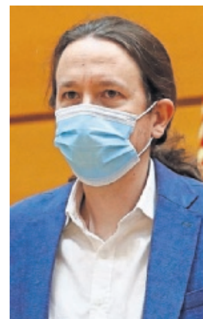
Pablo Iglesias, vicepresidente segundo del Gobierno.

100% para llevar a cabo estos cuidados, así como de adaptar la jornada. Sin embargo, Cortés indicó que muchas familias no pueden permitirse recortarse la jornada y el sueldo proporcionalmente. Y criticó que, en cualquier caso, "los cuidados recaen siempre sobre las mujeres"