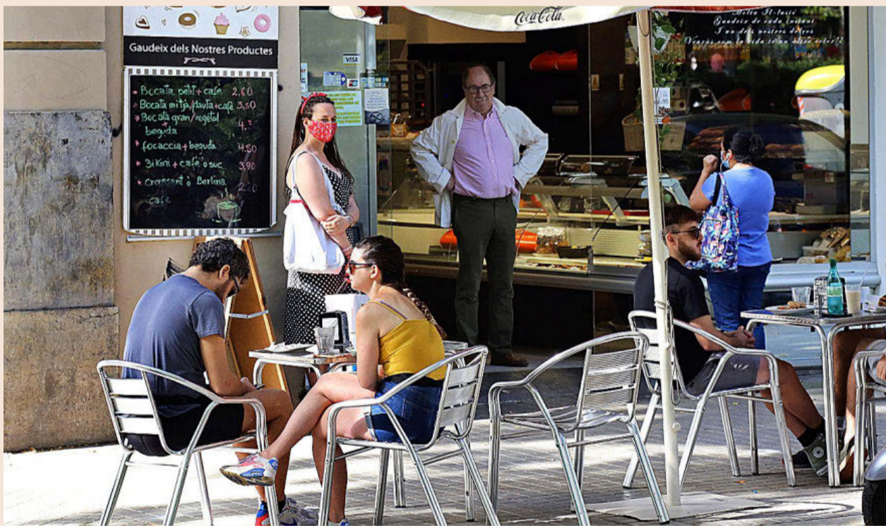
Establecimiento de degustación en el centro de Barcelona, con las mesas en la calle separadas para garantizar las distancias de seguridad.