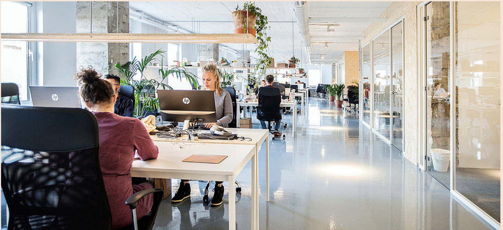
La digitalización es una de las palancas de transformación que cobrará relevancia entre los trabajadores por cuenta propia.