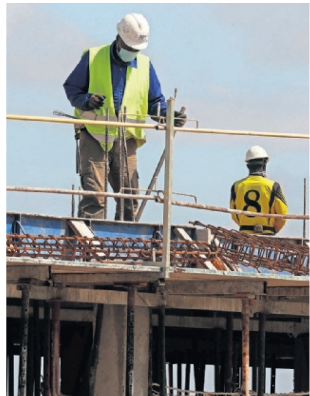
Dos trabajadores en una obra. PABLO MONGE

Este indicador se compone por: el coste salarial, que registró una variación anual del 4,6%; y por los otros costes (cotizaciones sociales, retribuciones extrasalariales, atrasos, com-