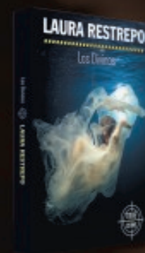
DOMINGO 2 DE AGOSTO Los adivinos Laura Restrepo