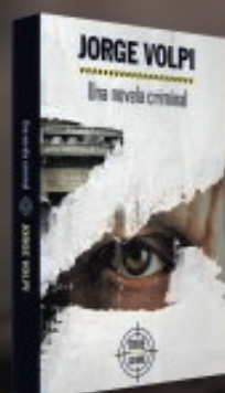
DOMINGO 19 DE JULIO Una novela criminal Jorge Volpi