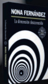
DOMINGO 5 DE JULIO Dimensión Desconocida Nona Fernández