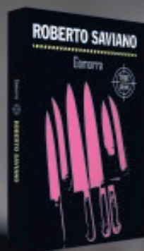
DOMINGO 28 DE JUNIO Gomorra Roberto Saviano

Una colección de 24 NOVELAS NEGRAS con los casos más famosos basados en hechos reales contados por los mejores autores del género. Muchos de los cuales tuvieron una gran repercusión en los medios de comunicación.