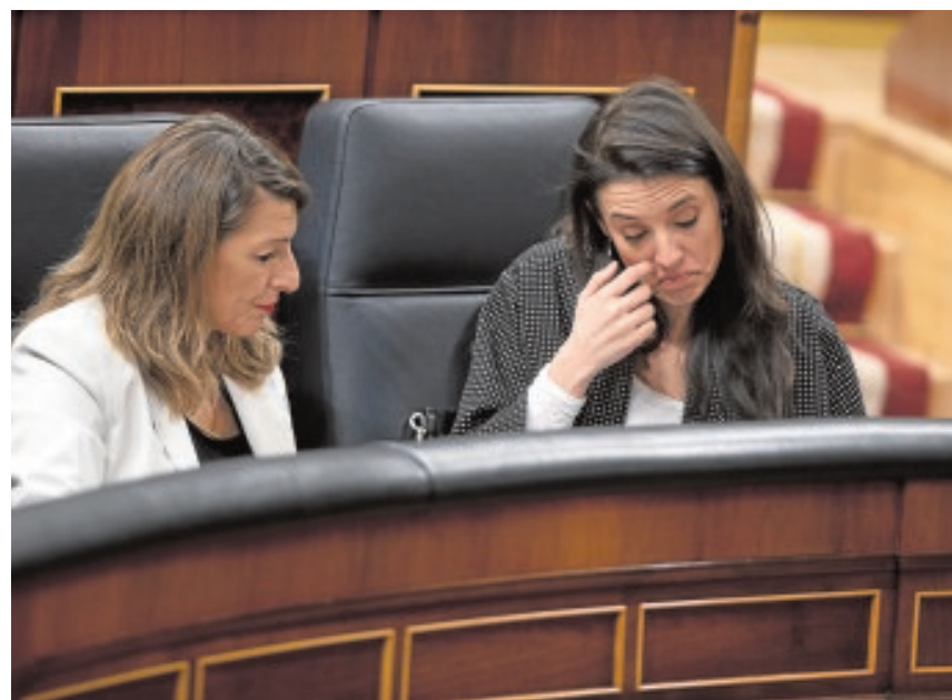
Las ministras de Trabajo e Igualdad, Yolanda Díaz e Irene Montero

mantener, en algunos casos, el empleo, como ya lo hicieron en la crisis de 2008. La CEOE ya avisó de despidos si el Gobierno tumbaba la reforma. Unas intenciones que, en la práctica, son inviables, teniendo en cuenta que la derogación de la legislación debería ir acompañada de una nueva para evitar el vacío normativo que se produciría por las normas desaparecidas.