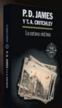
DOMINGO 26 DE JULIO La octava víctima P.D. James