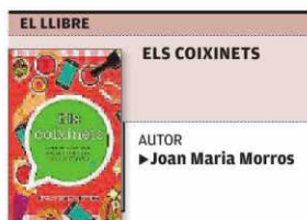
COLUMNA, BARCELONA, 349 PÀGINES

▶ Són dotze personatges i, amb algun d'ells, els lectors s'hi identifiquen al 100 % o quasi»