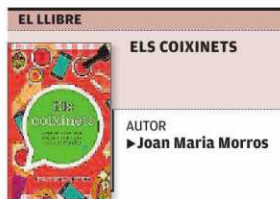
COLUMNA, BARCELONA, 349 PÀGINES

« Són dotze personatges i, amb algun d'ells, els lectors s'hi identifiquen al 100 % o quasi»