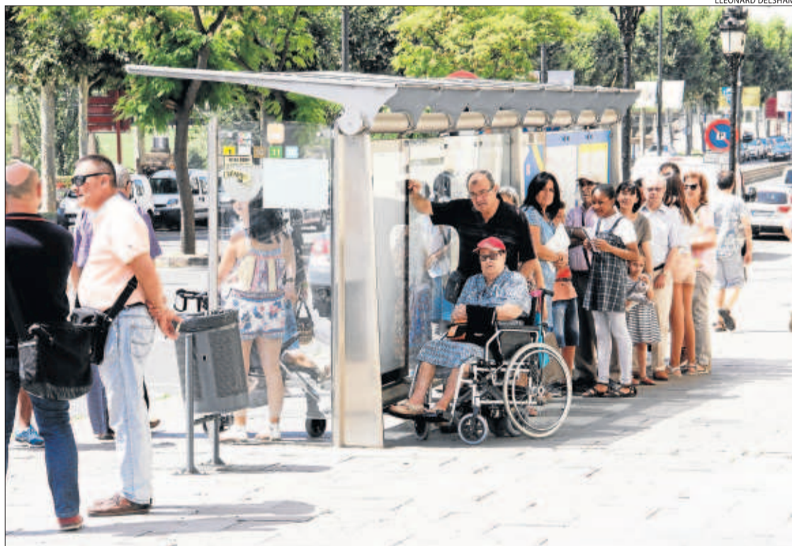
Usuaris de l'autobús 'refugiats' a la zona d'ombra d'una marquesina ahir al migdia.

preferits són els cementiris, perquè sempre hi sol haver rams en gerros amb aigua. "Als cementiris, tots els envasos on hi ha flors haurien d'estar foradats", va apuntar. Aquest expert assenyala que la seua eradicació és impossible i que la lluita ha de centrar-se a evitar que la població d'aquesta varietat assoleixi una densitat alta, per a la qual cosa resultaria clau conscienciar la població de les mesures a adoptar per dificultar que nidifiqui, així com tractaments regulars en punts de cria com els embornals. "El servei de control de mosquits al Baix Llobregat tracta 150.000 embornals de 24 municipis", va destacar.