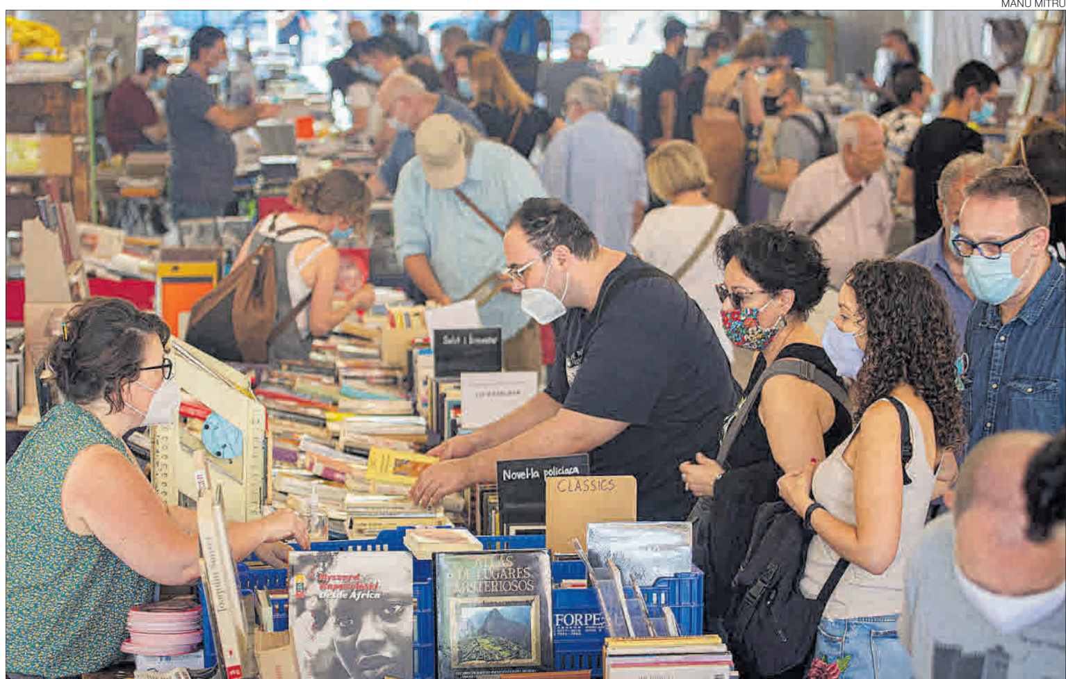
► El Mercat del Llibre Antic de Sant Antoni, a Barcelona, ahir, ple de gent.

El País Basc (que només desconeix l'11% dels contactes dels seus positius), Andalusia (15%) i les Canàries (23%) són les regions que millor estan en aquest sentit.